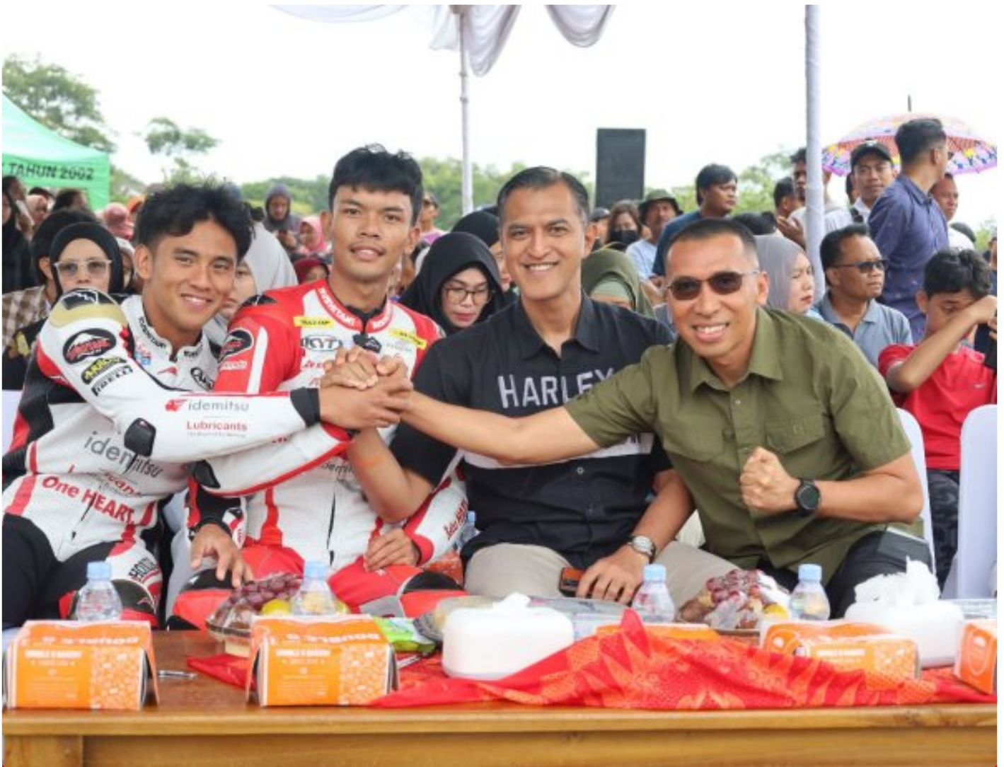
Dandim 0804/Magetan Hadiri Undangan Tinjau Sirkuit Magetan