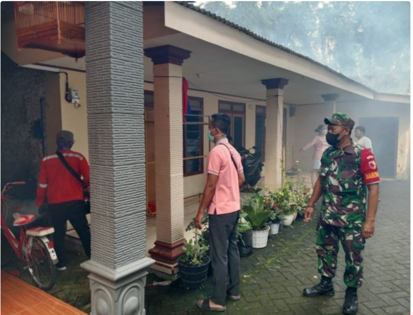
Babinsa Bersama Dinkes Dampingi Fogging, Cegah DBD di Wilayah Desa Binaan

Magetan. Babinsa desa Buluharjo, Koramil Tipe B 0804/02 Plaosan Serka Eko bersama dengan Dinas Kesehatan, Kepala desa Buluharjo dan Perangkat desa melaksanakan antisipasi potensi wabah penyakit demam berdarah akibat dari musim hujan di lokasi pemukiman warga RT 01 s/d RT 03 yaitu dengan cara melakukan fogging atau pengasapan (Pengasapan Pestisida nyamuk) Demam